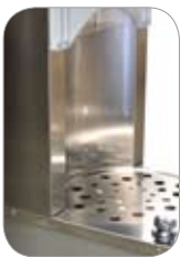
Grille inox pour carafes Stainless steel grid for water jugs