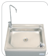
1 robinet col de cygne + 1 robinet rince-bouche 1 swan neck tap + 1 adjustable height jet tap