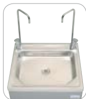
2 robinets col de cygne 2 swan neck taps