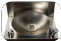
Robinet rince-bouche Adjustable height jet tap