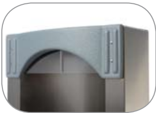
Sortie d'eau inox avec protection sanitaire Stainless steel water outlet with sanitary protection