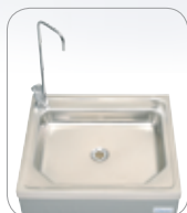
1 robinet col de cygne 1 swan neck tap